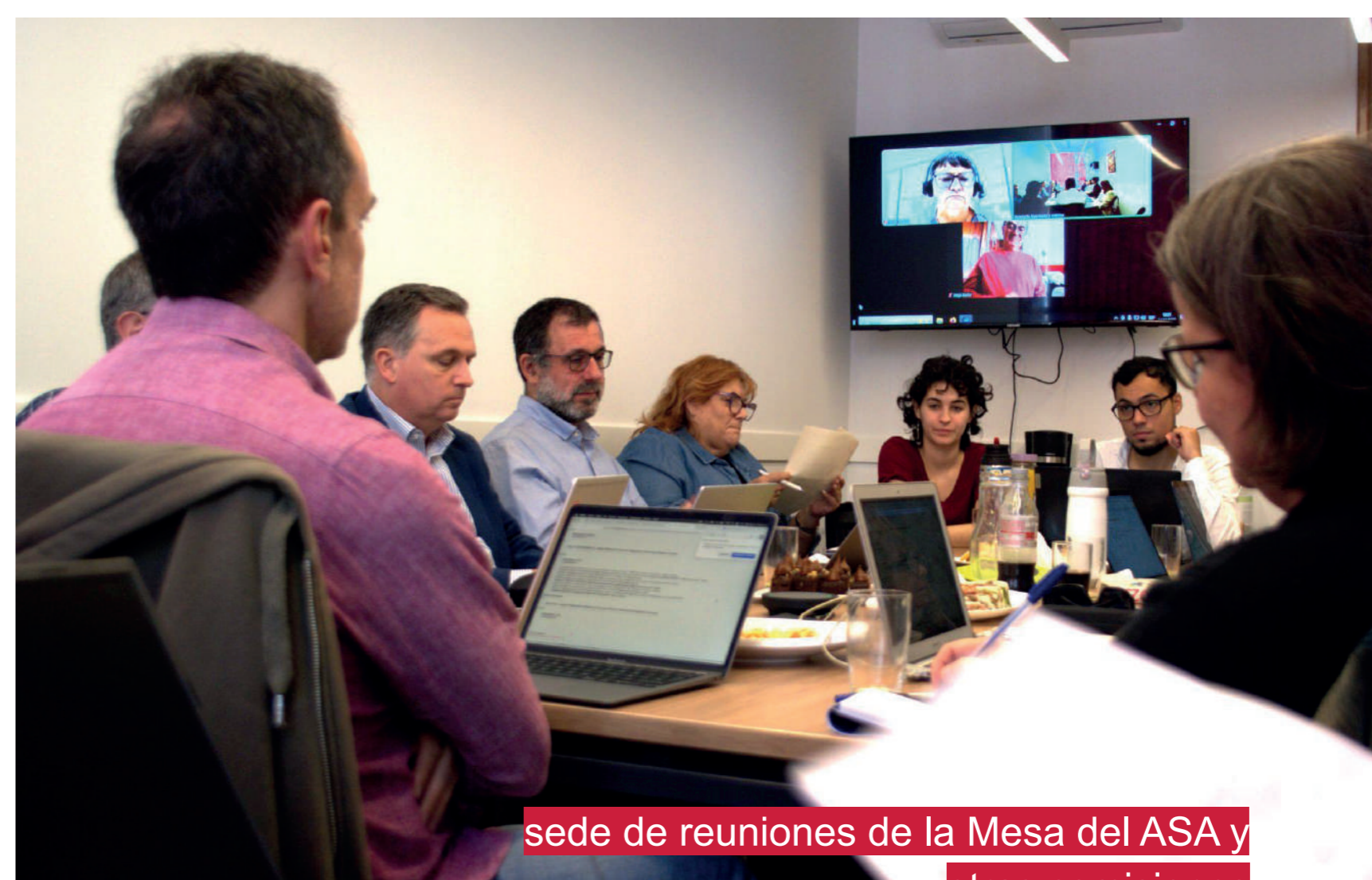
sede de reuniones de la Mesa del ASA y otras comisiones