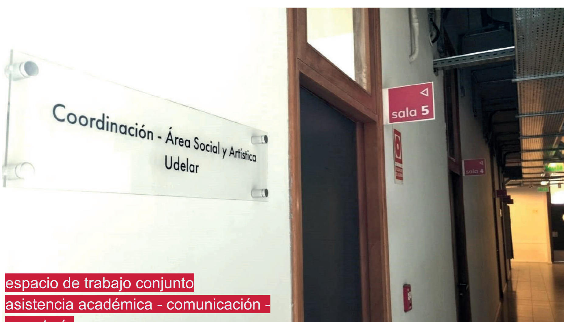
espacio de trabajo conjunto asistencia académica - comunicación - secretaría