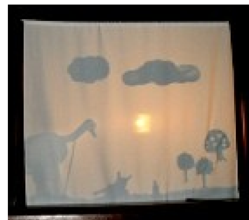
Dú y Babita