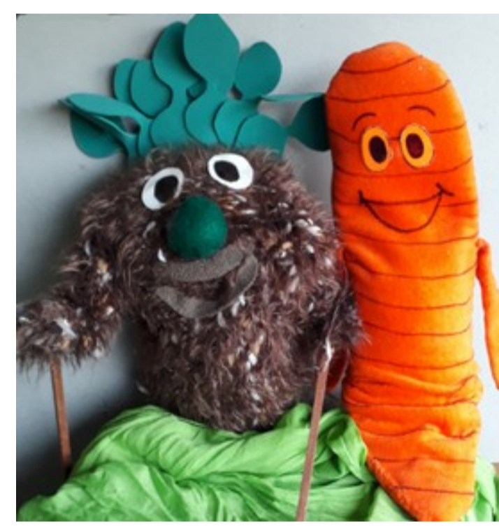
Jacinto y Lombrinita